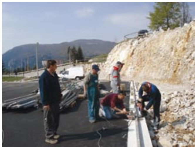
Na fotografiji: Tako smo začeli postavljati ogrodje nove večnamenske dvorane

cije za našo novo večnamensko dvorano, ko smo železno ogrodje postavljali skoraj izključno v večernih urah, pod reflektorji. Zato naj se ob tej priložnosti vsem članom Društva, ki so sodelovali pri tem, še posebej zahvalim, saj so delali v težkih razmerah, na veliki višini in ponoči.