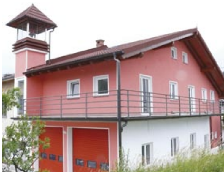
Na fotografiji: Prenovljeni gasilski dom v središču Cola

V treh desetletjih pa so prostori, ki so si jih colski gasilci uredili v letu 1979, postali premajhni in pretesni za vso opremo, nova vozila in vse številčnejše članstvo. Seveda ob tem ni bilo mogoče prezreti dejstva, da je staro stavbo načel zob časa, kritina je začela puščati, stavba brez izolacije pa je kot sito izgubljala toplotno energijo, za katero so morali colski gasilci plačevati vedno več. In tako je leta 2003 dokončno padla odločitev: gasilski