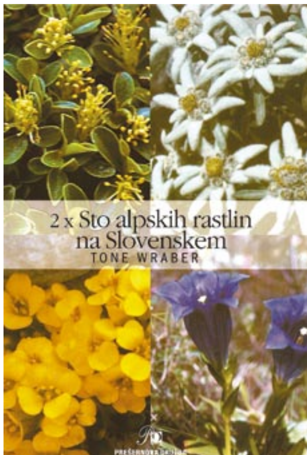
Na fotografiji: Tako vabi bralca naslovnica nove knjige dr. Wraberja

Ko gledam fotografijo, mi je nekam znana. A veliko smiljk si je podobnih. Moram jo poiskati. Ko pa jo najdem, boste bralci Gore to gotovo zvedeli.