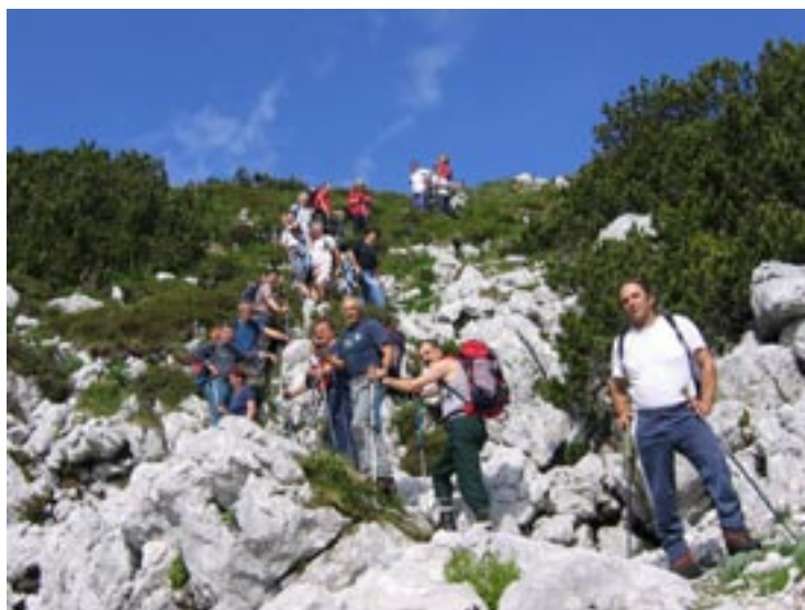
Na fotografiji: S poti na Krasji vrh