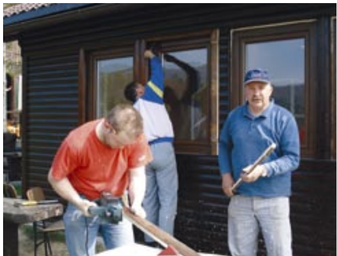
Na fotografiji: Z delovne akcije

Ko se zima poslovi, je čas za »generalno spomladansko čiščenje«. Tako smo kot že vsako leto doslej tudi letos v Društvu izvedli delovno akcijo. Čakalo nas je temeljito čiščenje notranjosti društvenih prostorov in pa ureditev okolice športnega parka. Naloga ni bila prav lahka, saj se nam je na podstrešju nabralo že toliko raznovrstnega neuporabnega materiala, da smo pri Komunalno stanovanjski družbi Ajdovščina naročili kar dva zabojnika za kosovni odpad. Ker se nas je zbralo okrog 30, smo se razdelili v tri skupine. Prva je čistila in pospravljala prostore ter okolico koč, druga je po-