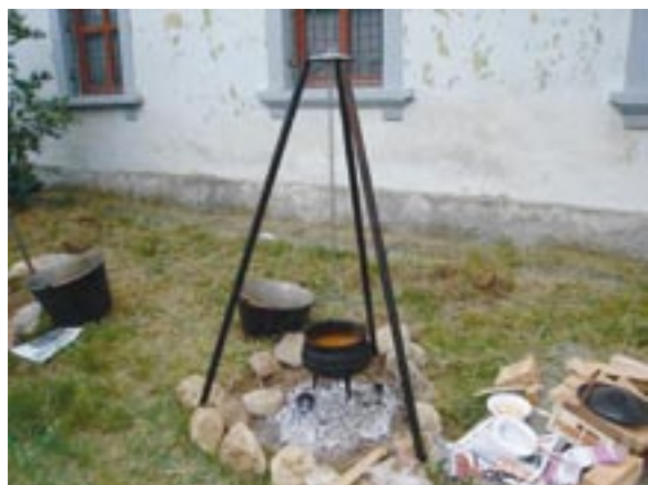
Na fotografiji: Tako smo kuhale