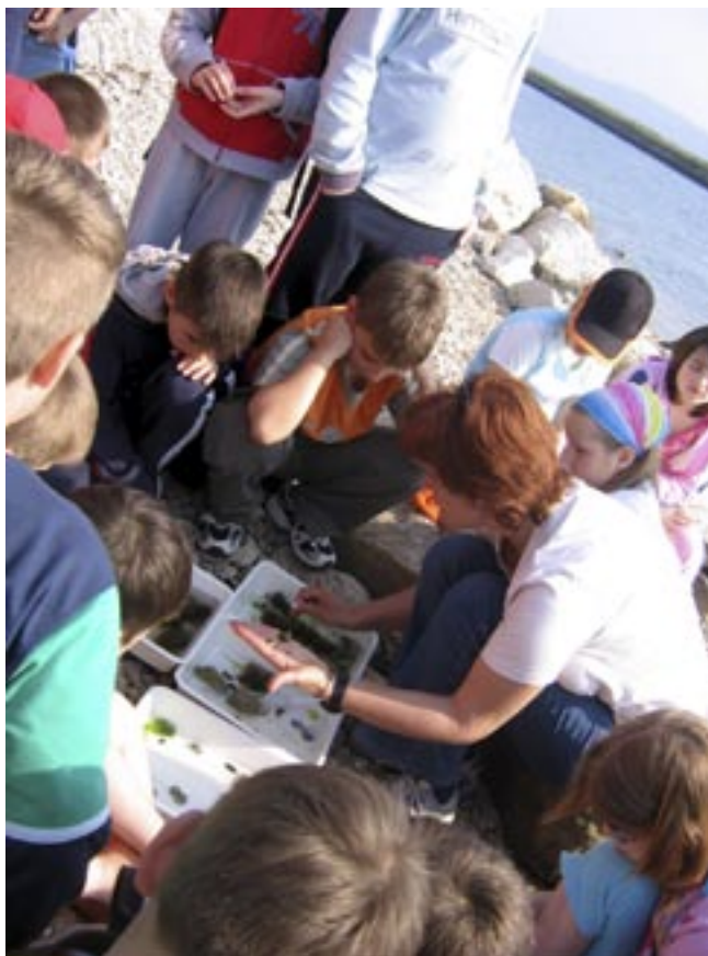
Na fotografiji: Raziskovanje živali in rastlin v pasu bibavice

Vožnja je bila zelo prijetna, saj so se otroci, polni pričakovanj, z navdušenjem spraševali, kaj jih čaka v prihodnjih dneh. Pred Sečo, kjer so nas pred domom Burja že čakali predstavniki centra za šolske in obšolske dejavnosti, se je vzdušje že toliko sprostito, da se je iz zadnjega konca avtobusa že slišalo veselo petje. Otroci so imeli takoj po prihodu polne roke dela, tako da za razmišljanje o domu niso imeli veliko časa. Njihovi dnevi so bili zapolnjeni s plavalnim tečajem in naravoslovnimi delavnicaми, kjer so spoznavali obmorski svet in njegove podnebne značilnosti, rastlinstvo ter živali. Poleg tega so sami skrbeli zase, za svojo higieno in svoje stvari, za urejenost bungalovov ter za red v jedilnici med obroki. Kljub napornemu delavniku so zvečer našli še toliko energije, da so se družili in se zabavali.