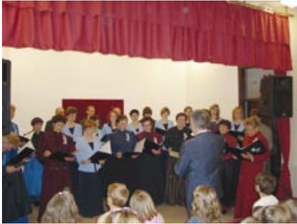
Na fotografiji: Skupaj z Angelskim spevom