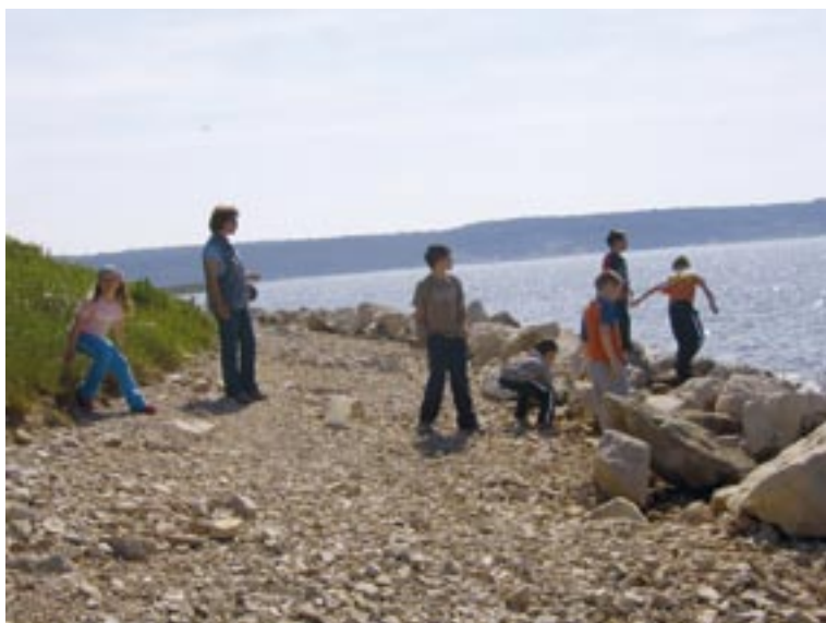
Na fotografiji: Sprostitev ob morju

Bilo mi je zelo lepo. Učiteljica nas je zjutraj zbudila in odšli smo na zajtrk. Tam je bilo veliko otrok. Po zajtrku smo odšli v hiške. Tam smo se preoblekli v kopalke in odšli na bazen. Po kopanju smo imeli nara-voslovni dan. Tam smo se naučili veliko zanimivega. Ogledali smo si tudi vrt kaktusov.