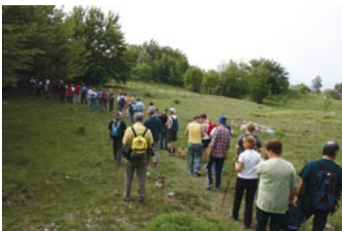
Na fotografiji: Nekaj utrinkov s pohoda