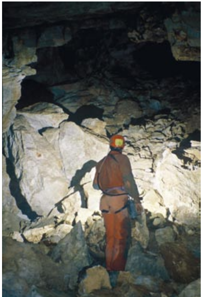
Na fotografiji: Podorni bloki, skozi katere smo odkriti pot do trenutno najnižje točke v jami.