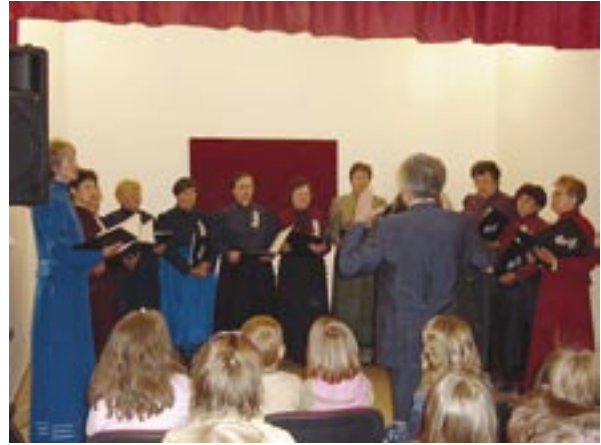
Na fotografiji: Naša pevna skupina

skeči. Odlično so zaplesale tudi njihove plesalke.