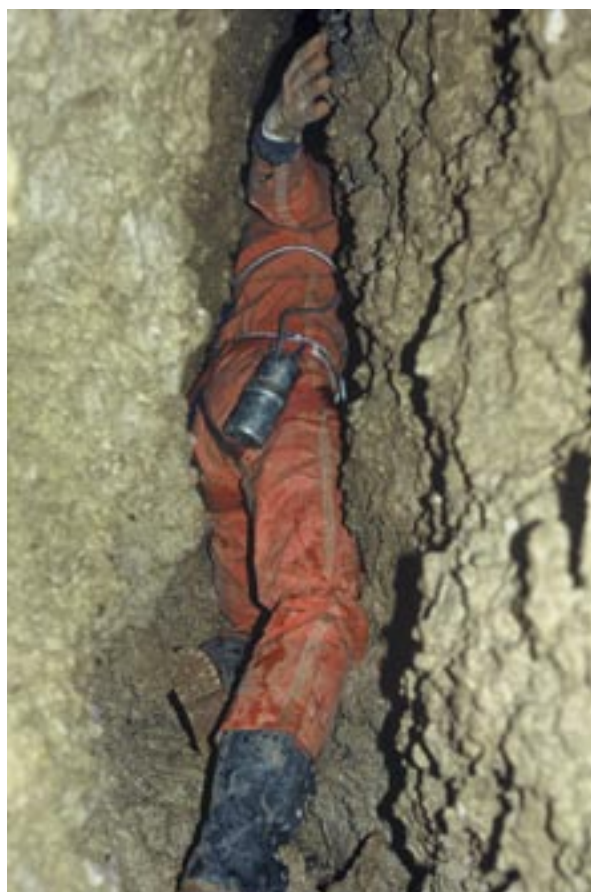
Na fotografiji: Skozi ožino, imenovano Glista, vodi pot do globine 384 m.

Med vsemi zgodbami iz tistega obdobja je morda še najbolj zanimiva tista o tem, kako so našli prehod do najnižje točke. Med tem ko sta dva jamarja sedela pred zoprno ozko špranjo, jo ogledovala in premišljevala, ali je za nadaljeva-ti ali ne, ju je dohitel tretji član, ki se je do sedaj potikal po drugih špranjah. Zanimalo ga je, kje