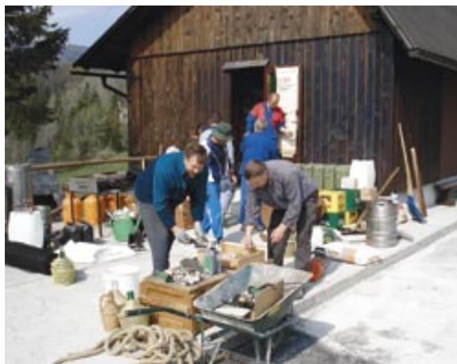
Na fotografiji: V delovni akciji letos maja smo med drugim popravili društvene prostore in uredili okolico športnega parka