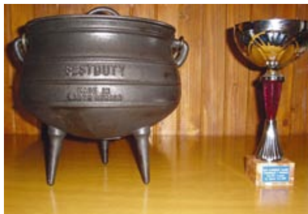
Na fotografiji: Naš pokal za 2. mesto

Pod ostalimi kotli (vsi so bili večji kot naš in iz kovine), so goreli močni ognji. Pod našim kotličkom se niti kadilo ni. Spet ni bilo nekaterim jasno, kako bom skuhalo, če je ogenj ugasnil. »O, mi imamo takega, da v njem 'miga' brez njega,« smo se smejale.