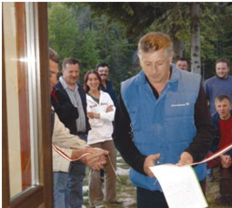
Na fotografiji: 27. aprila smo se veselili ob odprtju lepo urejenega prostora pod nekdanjim nadstreškom

stavljala oblogo pri pokritem nadstrešku koč, tretja pa je začela postavljati ogrodje nove hale. Ko smo počistili ter pospravili podstrešje, izločili vso šaro ter uredili okolico, sta bila zabojnika polna. Trava je bila pokošena, grmovje obrezano, skalnjak in cvetlična korita pa brez plevela in z novim cvetjem, ki nas bo razveseljevalo vse leto. Namen akcije je bil dosežen. Vsem sodelujočim se zahvaljujem za udeležbo in z veseljem lahko rečem, da so nekateri člani res s srcem in z dušo v Društvu. Prispevali so ogromno delovnih ur in brez njihove pomoči na Rupi zagotovo ne bi imeli tako lepih društvenih prostorov, športnega parka in tudi nove večnamenske dvorane.