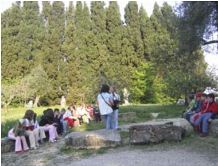
Na fotografiji: Preučevanje obmorskih rastlin

Šola v naravi mi bo ostala v lepem spominu, ker sem se naučila pravilno plavati. Naučila sem se skakati na glavo in na noge. Z rokami sem ujela ribo babico. Naučila sem se prijeti rakovico. Spoznala sem veliko živali. Bilo je lepo. Tina P., 3. r.