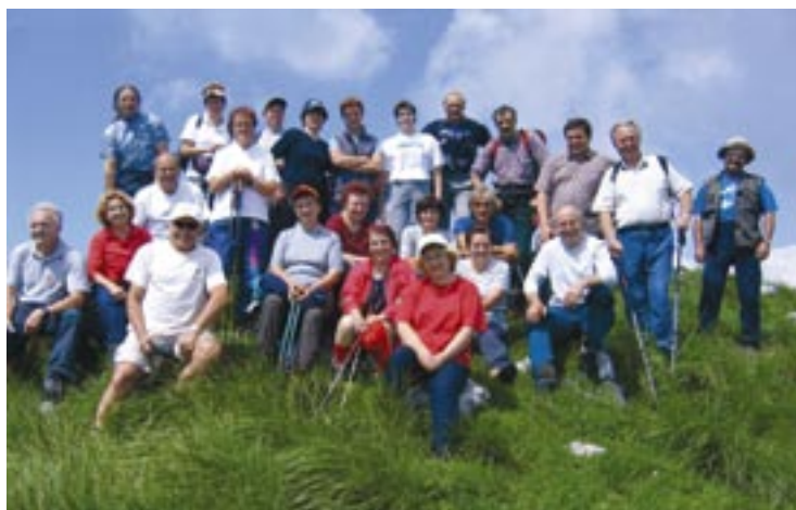
Na fotografiji: Na Krasjem vrhu pa še ena gasilska